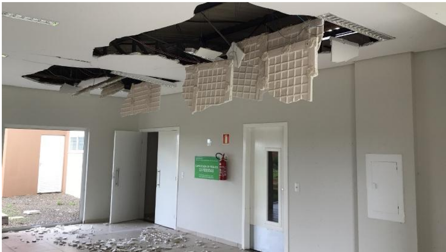
Imagem da Universidade do Oeste do Paraná - UNIOESTE, Campus Foz do Iguaçu, evidenciando danos no revestimento de teto, pisos e esquadrias.

Imagem da Universidade do Oeste do Paraná - UNIOESTE, Campus Foz do Iguaçu, evidenciando danos na parte elétrica, infraestrutura lógica e na cobertura.