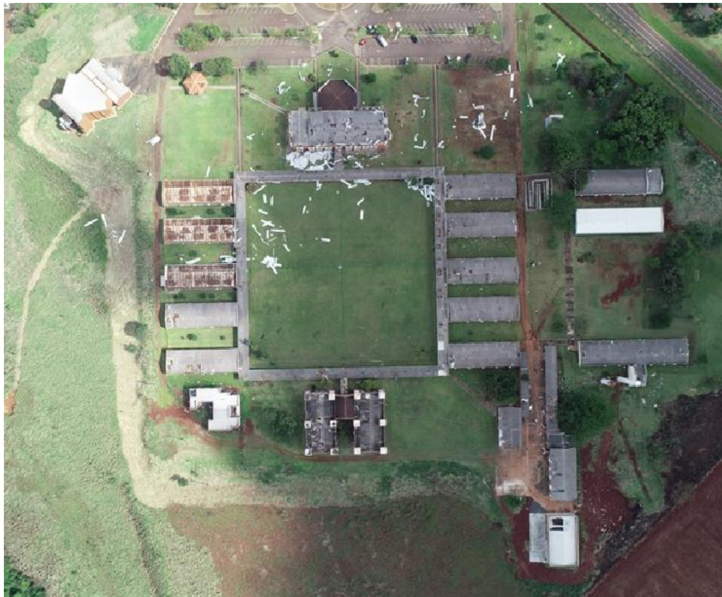
Imagem da situação na qual a Universidade do Oeste do Paraná - UNIOESTE, Campus Foz do Iguaçu, logo após ser atingida pela tempestade.