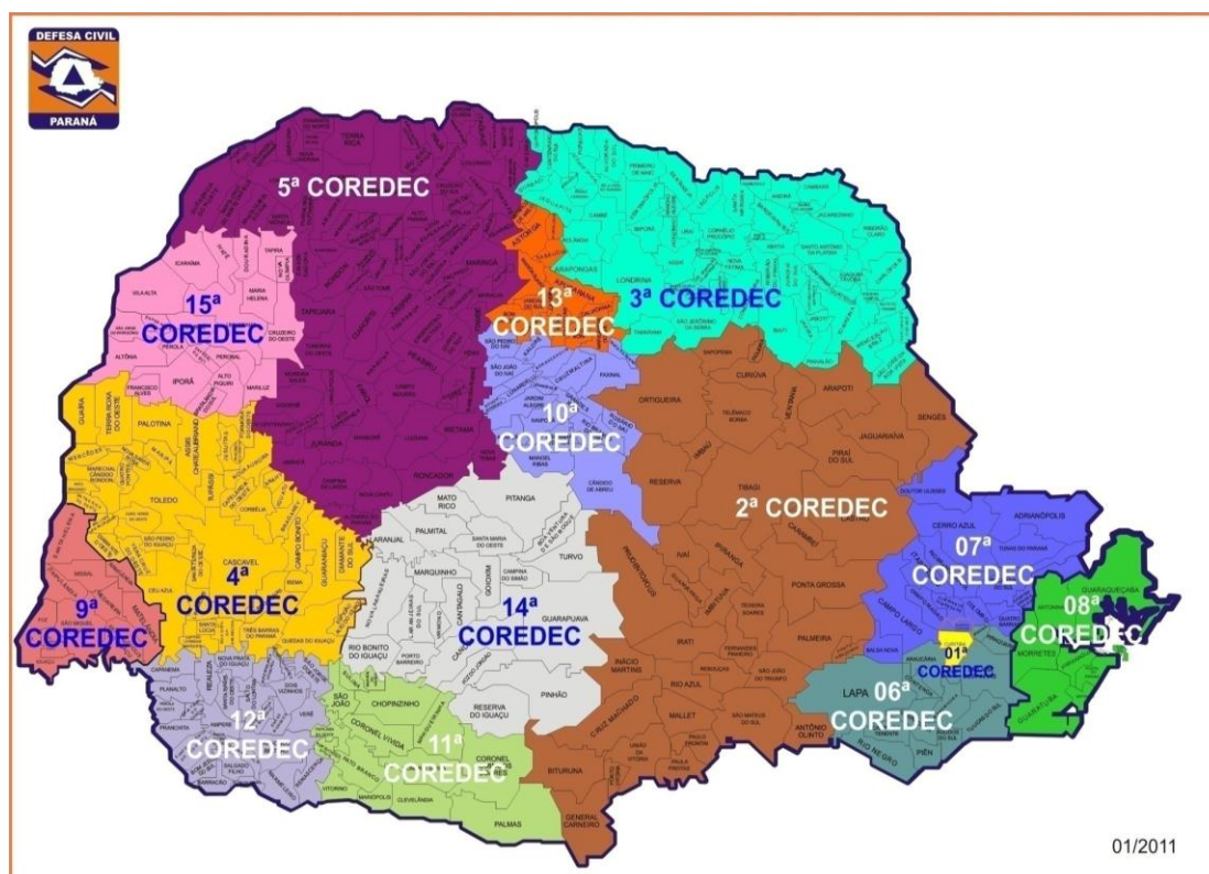
FIGURA 3 – NÚCLEOS REGIONAIS DE EDUCAÇÃO