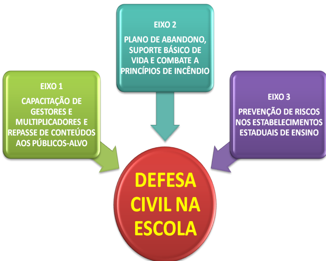
FIGURA 1 – O PROGRAMA E OS EIXOS DE EXECUÇÃO